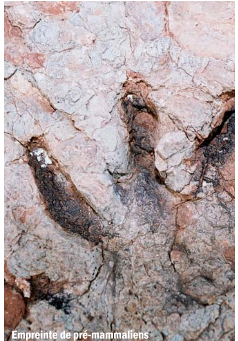
Empreinte de pré-mammaliens

Lors de travaux routiers, il y a quelques années, des traces de reptiles pré-mammaliens vivant ici il y a 250 M.a. ont été découvertes. Ces animaux avaient des similitudes physiques avec les mammifères actuels. De cette époque, 95% des espèces ont disparu. Notre espèce descend de ces quelques survivants. Ces animaux étaient présents bien avant les dinosaures qui firent leur apparition 40 millions d'années plus tard, au début de l'ère secondaire. On a également retrouvé des traces de ces pré-mammaliens en Afrique du Sud et en Asie, ce qui démontre l'existence d'un continent unique. On découvre sur le site de la Lieude quelques 950 pas groupés en 15 à 20 pistes de différentes espèces de pré-mammaliens.