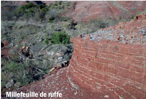
Millefeuille de ruffe

La ruffe (grès à grains de silice très fins entourés d'oxyde de fer) est issue de la sédimentation de boue (sable et argile). Cette dernière provient de l'usure, de l'érosion des massifs montagneux alentours (aux environs de 6 000 mètres d'altitude). La pluie a charrié ces boues qui se sont oxydées donnant la couleur rouge. Elles se sont déposées durant des millions d'années. Aujourd'hui, ces anciens massifs sont complètement érodés. Des torrents et des rivières ont transporté cette « ruffe ». Au pied de ce massif, un bassin a reçu les boues rouges qui se sont compactées. Au centre de celui-ci l'épaisseur de la ruffe rouge et grise est estimée à 2 500 mètres. Un enfoncement naturel lent et constant du fond de ce bassin explique le phénomène. La ruffe, recouverte par la mer de l'ère secondaire, a laissé les « calcaires » et les « dolomies » de nos paysages actuels. Au début de l'ère tertiaire, le bassin est une nouvelle fois soulevé et plissé, les Pyrénées se forment à ce moment là.