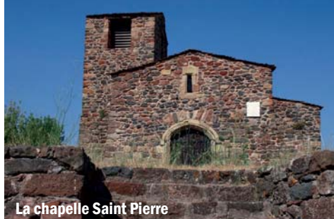
La chapelle Saint Pierre