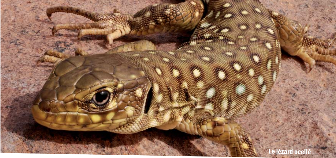
Le lézard ocellé