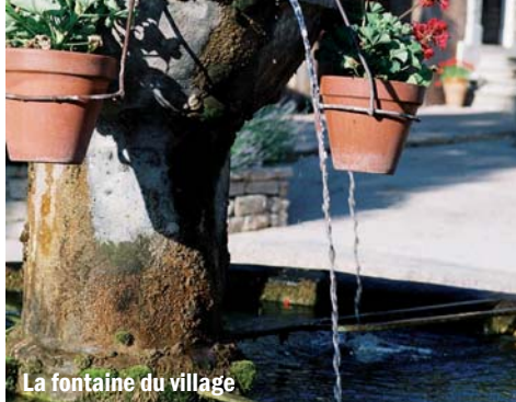
La fontaine du village