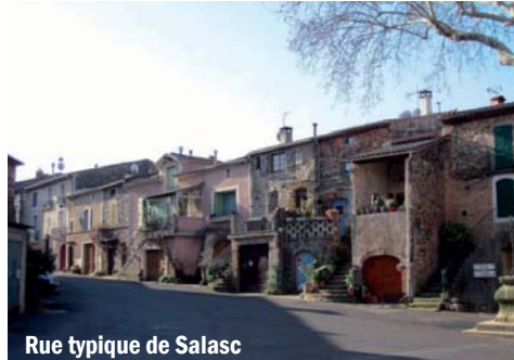
Rue typique de Salasc