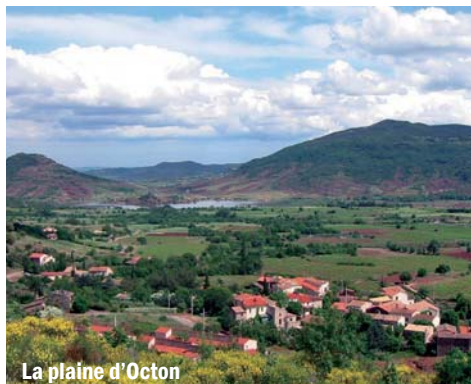
La plaine d'Octon

Avant la mise en eau du lac du Salagou, la plaine était dédiée à l'agriculture et au pastoralisme. Les paysages étaient différents, l'homme a façonné la vallée du Salagou en fonction de l'évolution de l'agriculture et des modes de vie. Après la mise en eau, l'agriculture a dû s'adapter à ce nouveau milieu et évoluer. On peut voir des anciennes « capitelles », abris en pierres sèches, qui servaient aux bergers et aux paysans d'autrefois. Actuellement, une vingtaine d'éleveurs sont présents sur le territoire du Grand Site et lui redonnent sa destination d'autrefois. La viticulture n'est pas en reste avec de nombreux caveaux et domaines viticoles à découvrir.