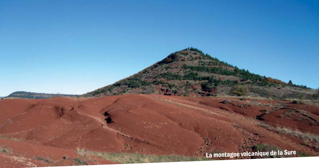
La montagne volcanique de la Sure